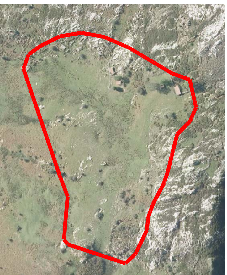
ORTOFOTO MAJADA DE ABAJO E=1/2.500

El presente documento es una obra de ingeniería, arquitectura, urbanismo, paisajismo, etc., que ha sido elaborada por el autor con el fin de proporcionar información y asesoramiento técnico y profesional. El autor no se responsabiliza de los daños o perjuicios que puedan derivarse del uso indebido o incorrecto de la información contenida en este documento. El autor no se responsabiliza de los daños o perjuicios que puedan derivarse del uso indebido o incorrecto de la información contenida en este documento.