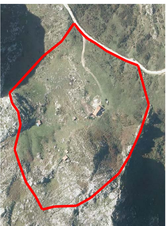
ORTOFOTO MAJADA DE ARRIBA E=1/2.000